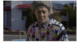
まるごとひょうたんロック・ユー!! http://2017.oimf.jp/movie/detail/28/

2018 「都庁爆破!」(TBS 新春ドラマスペシャル) http://www.tbs.co.jp/tocho-bakuha/