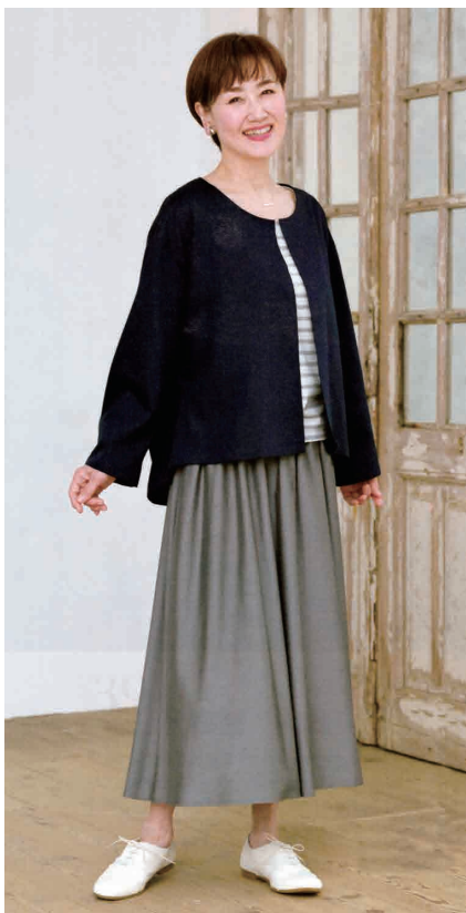
ブティック社「60代からのソーイング」